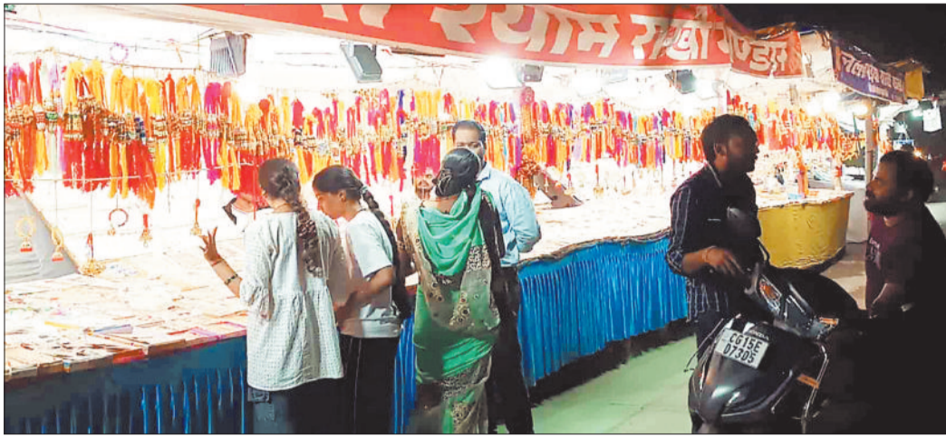
राखी की खरीदारी करते करते लोग।

राखी पर्व को लेकर शहर के स्कूल रोड, देवीगंज रोड, घड़ी चौक, दुर्गा बाड़ी के अलावा मुख्य मार्ग किनारे कई जगह बड़ी संख्या में राखी दुकान लगाई गई है जहाँ बड़ी संख्या में बहनों की भीड़ राखी लेने पहुंच रही है। हालांकि कुछ दिन पूर्व दुकानों में गिने चुने ही ग्राहक आ रहे थे परंतु जैसे ही रक्षा बंधन का त्यौहार नजदीक आ रहा है वैसे ही दुकानों में भीड़ उमड़ने लगी है। इधर भाई की कलाई में कौन सी राखी अच्छी लगेगी इसके लिए बहने काफी समय दुकान में राखियां पसंद करते नजर