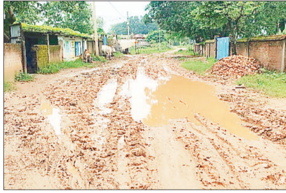
आमपारा पहुंच मार्ग पर गड़दे - बैकुंठपुर जनपद पंचायत अंतर्गत वाम कंचनपुर से आमपारा जाने के लिए कुछ ही दूरी पर दो-दो मार्ग निकले हैं, इनमें से एक मार्ग के शुरूआत में ही सड़क पर कई गड़दे हो गए हैं, जहां पर संभल कर चलना पड़ता है, इसके बाद सड़क की स्थिति ठीक है। जानकारी के अनुसार कंचनपुर बुडार मार्ग के बीच निकलना यह मार्ग वाम बुडार की सीमा पर मुख्य मार्ग से निकलती है जो चारपारा आमपारा की ओर जाती है उसी स्थल से कुछ दूरी पर आमपारा के लिए दूसरी पक्की सड़क निकली है, जिसकी हालत ठीक है।

बरसात के सीजन में जिले के कई ग्रामीण क्षेत्रों की कच्ची सड़क की स्थिति खराब हो जाती है, ऐसी सड़कों से आवागमन करने में ग्रामीणों को भारी परेशानी का सामना करना पड़ता है। इस तरह की स्थिति से जूझ रहे ग्रामीणों को प्रतिदिन कीचड़ भरी सड़क के बीच से होकर आने-जाने की मजबूरी बनती है। इसी तरह का हाल बैकुंठपुर जनपद पंचायत के ग्राम कसरा का है। जिला मुख्यालय बैकुंठपुर से कुछ ही दूरी पर स्थित ग्राम कसरा के खुटारापारा में स्थित कच्ची सड़क जो कि गांव के प्रमुख सड़क में गिनी जाती है। इस बरसात में कसरा खुटारापारा के इस मार्ग में एक जगह पर कीचड़ बन गया है, इसके बीच से होकर प्रतिदिन